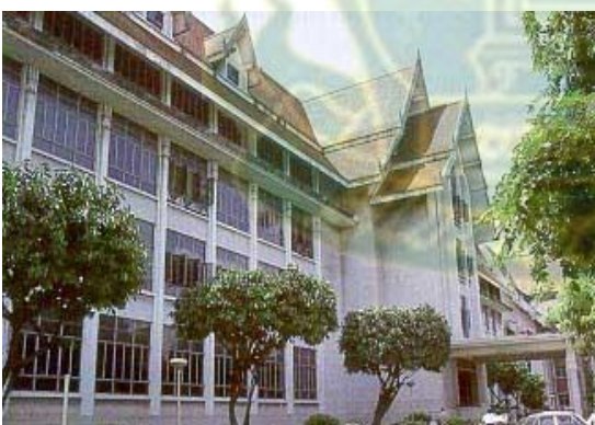
หอสมุดแห่งชาติ กรุงเทพฯ