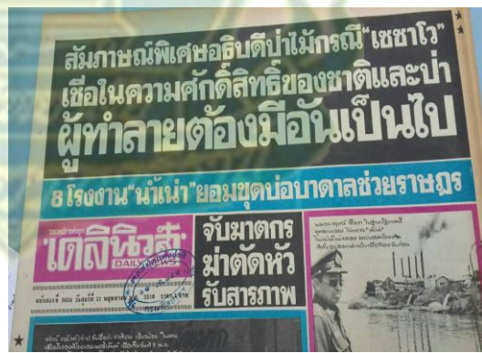
ข่าวจากหนังสือพิมพ์เกี่ยวข้องกับนายตรี กกก้าแหง