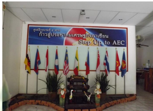
ห้องสมุดโรงเรียนอบรบวณกรรม จ.ตาก