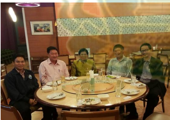
ศาสตราจารย์ ดร.สนธิ อักษรแก้ว ที่ร้านอาหาร กรุงเทพฯ