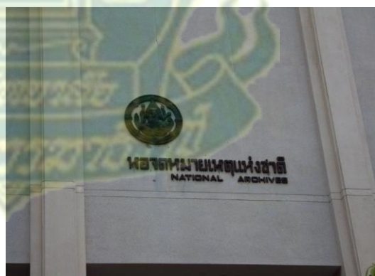
หอจดหมายเหตุแห่งชาติ กรุงเทพฯ