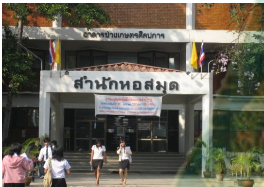
หอสมุดกลาง มหาวิทยาลัยเกษตรศาสตร์ กรุงเทพฯ