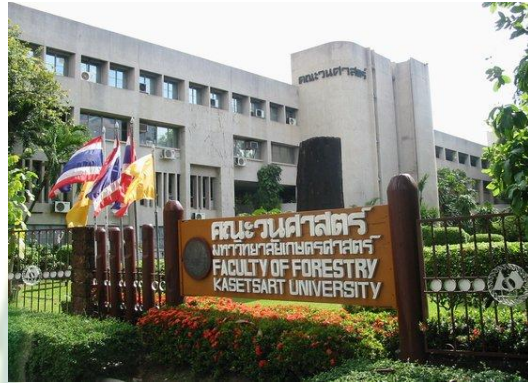
ห้องสมุดคณะวนศาสตร์ กรุงเทพฯ