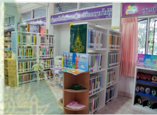
สำนักบรรณสารสนเทศ มสธ. จ.นนทบุรี