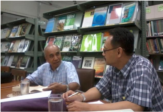
ห้องสมุดกรมป่าไม้ กรุงเทพฯ