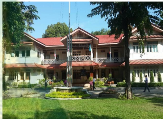
สำนักงานบริหารพื้นที่อนุรักษ์ที่ 12 จ.นครสวรรค์ (สำนักงานป่าไม้เขตนครสวรรค์เดิม)