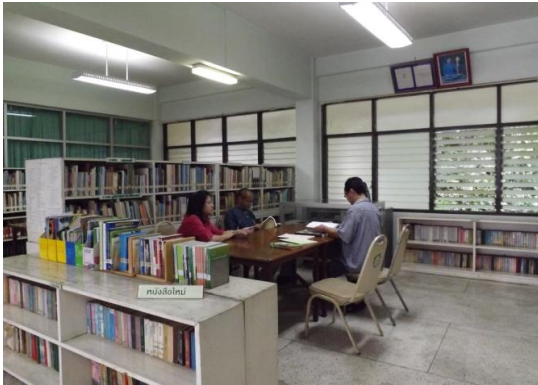
ห้องสมุดโรงเรียนป่าไม้แพร์ จ.แพร่