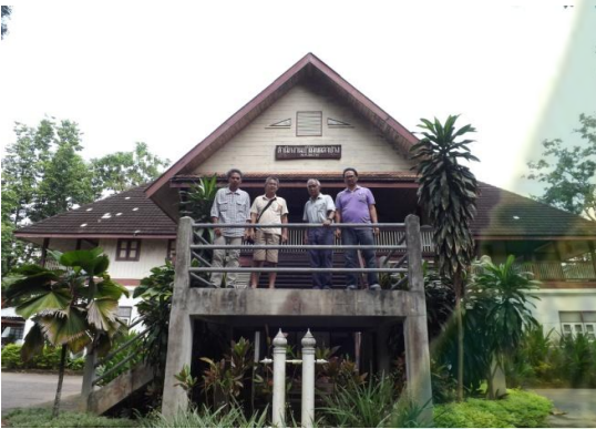
สำนักงานบริหารพื้นที่อนุรักษ์ สาขาลำปาง จ.ลำปาง (สำนักงานป่าไม้เขตลำปางเดิม)